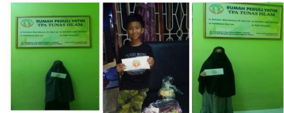
# Santunan Lebaran Yatim