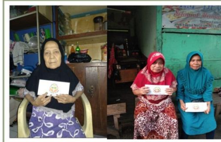
ZAKAT untuk JANDA DHU'AFA