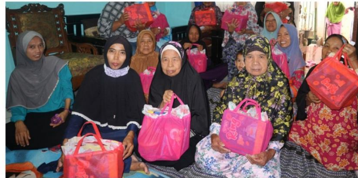
Parcel Lebaran dan Zakat Janda Dhuafa