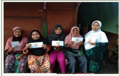
ZAKAT untuk JANDA DHU'AFA