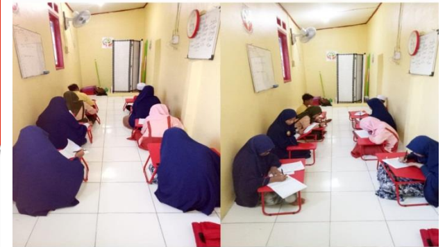
Rumah Peduli Yatim Dhuafa Cabang Koja Jakarta Utara

Mendidik adalah Tugas dari Orang Terdidik