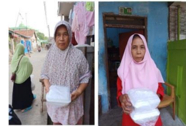
#Fidyah Kaum Muslimin