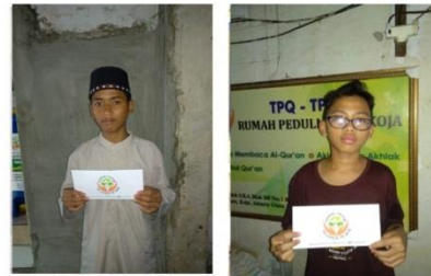
# Santunan Lebaran Yatim