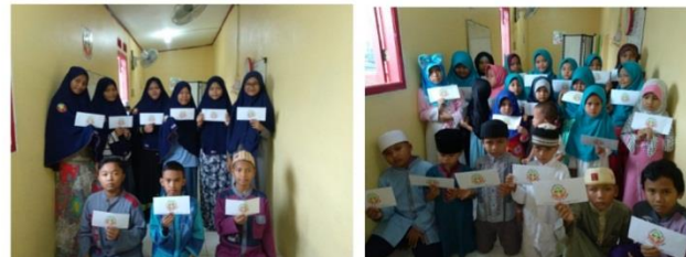
# Santunan Lebaran Yatim