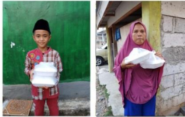
#Fidyah Kaum Muslimin