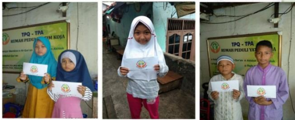
# Santunan Lebaran Yatim