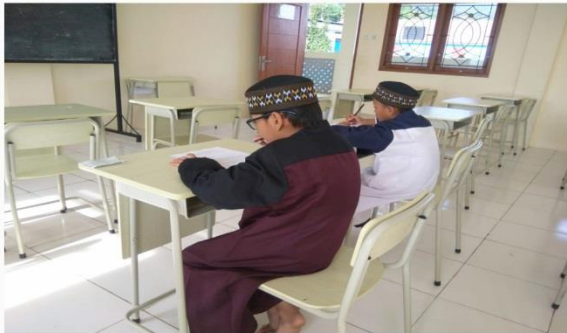
Asrama Rumah Peduli Yatim Dhuafa Cabang Bogor

Mendidik adalah Tugas dari Orang Terdidik