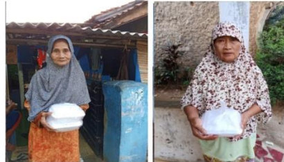
#Fidyah Kaum Muslimin