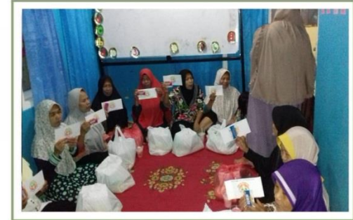
ZAKAT untuk JANDA DHU'AFA